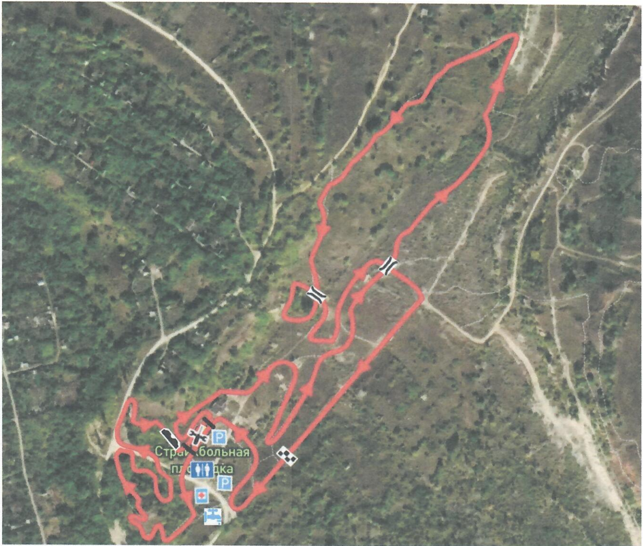
Рисунок 2 Трасса первенство ЦФО кросс-кантри